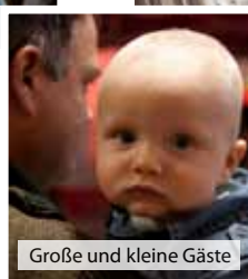
Große und kleine Gäste