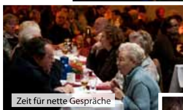
Zeit für nette Gespräche