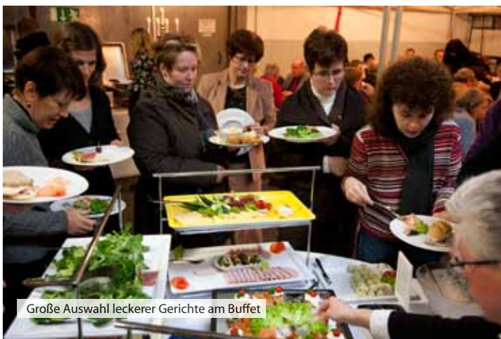
Große Auswahl leckerer Gerichte am Buffet