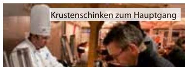
Krustenschinken zum Hauptgang